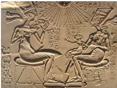
La famiglia reale. Akhenaton e Nefertiti.

Secondo Nicholas Reeves, archeologo presso l'università dell'Arizona: "Per la prima volta nella storia recente, potremmo essere davanti alla sepoltura intatta di un faraone egizio nella Valle dei Re". È possibile quindi che dietro queste porte si trovi la tomba della più bella regina d'Egitto di tutti i tempi: Neferneferuator Nefertiti, conosciuta come Nefertiti, sposa reale del grande faraone Akhenaton.